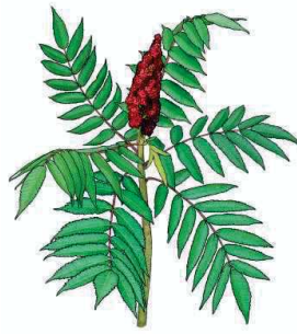
Essigbaum Rhus typhina