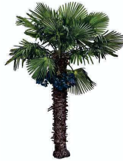
Chinesische Hanfpalme Trachycarpus fortunei