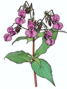
Drüsiges Springkraut Impatiens glandulifera