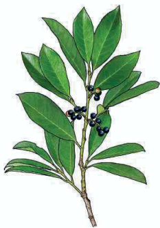
Kirschlorbeer Prunus laurocerasus