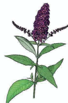
Sommerflieder Buddleja davidii