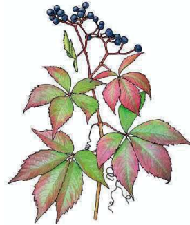
Fünffingerige Jungfernebe Parthenocissus quinquefolia