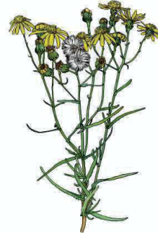
Schmalblättriges Greiskraut Senecio inaequidens