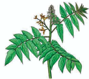
Götterbaum Ailanthus altissima