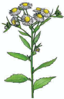
Einjähriges Berufkraut Erigeron annuus