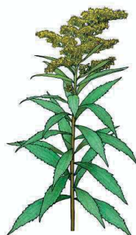
Nordamerikanische Goldruten Solidago canadensis, Solidago gigantea