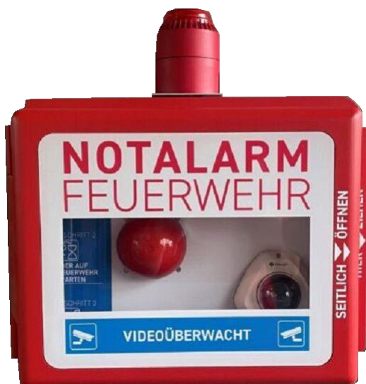
Notalarmbox beim Eingang zum Feuerwehrmagazin Mellingen

Die Feuerwehr Regio Mellingen (Mägenwil, Mellingen, Tägerig und Wohlenschwil) stellt sich der veränderten Risikolage und bietet eine neue Möglichkeit zur Notalarmierung.